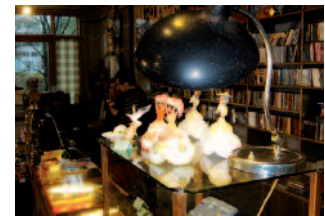
Hanseplatte hat nicht nur Vinyl und CDs, sondern auch kleine Geschenke für jeden Geldbeutel.