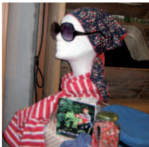
Hier kauft Charlotte Roche ihre Kopftücher